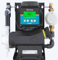
TD Pro SK