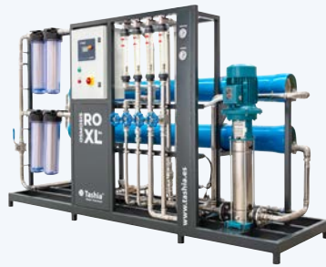
OMI RO XL