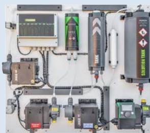
Dioxer Pro Batch