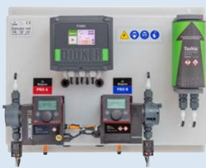
Dioxer Pro In-Line