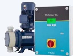
TD Doser XL